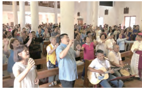
▲敬拜讚美，高聲詠唱，手足舞蹈，奔向天父。