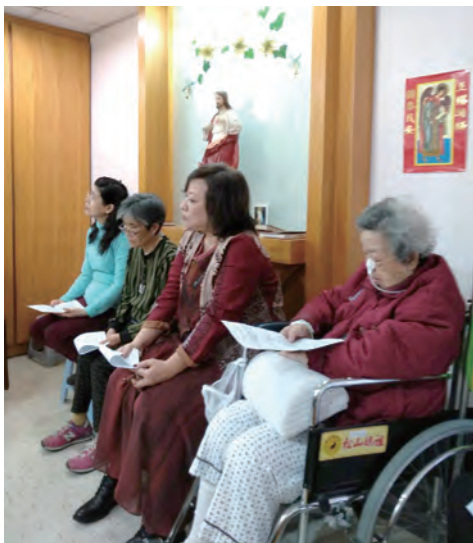
▲病患與家屬一起參與祈禱室的感恩彌撒