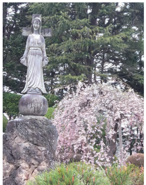
▲在繁花綠蔭中的微笑聖母，使人身心靈舒寬愉悅。