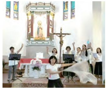
▲台東同禱會兄姊主領敬拜讚美。