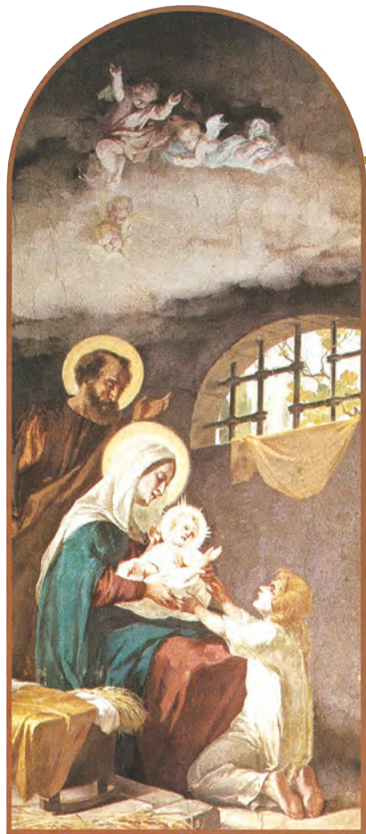
▲第3幅濕壁畫：聖母瑪利亞告訴小德蘭，嬰孩耶穌就是引她走向天國的模範。

今年適逢聖女小德蘭入會100周年，教宗碧岳十一世稱她為「在他教宗任內的一顆明星」，1927年宣布她為傳教區主保。