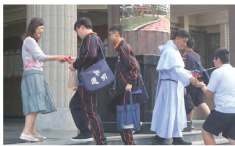
▲發送復活蛋、復活卡，祝福每位師生蒙受生命的喜悅！