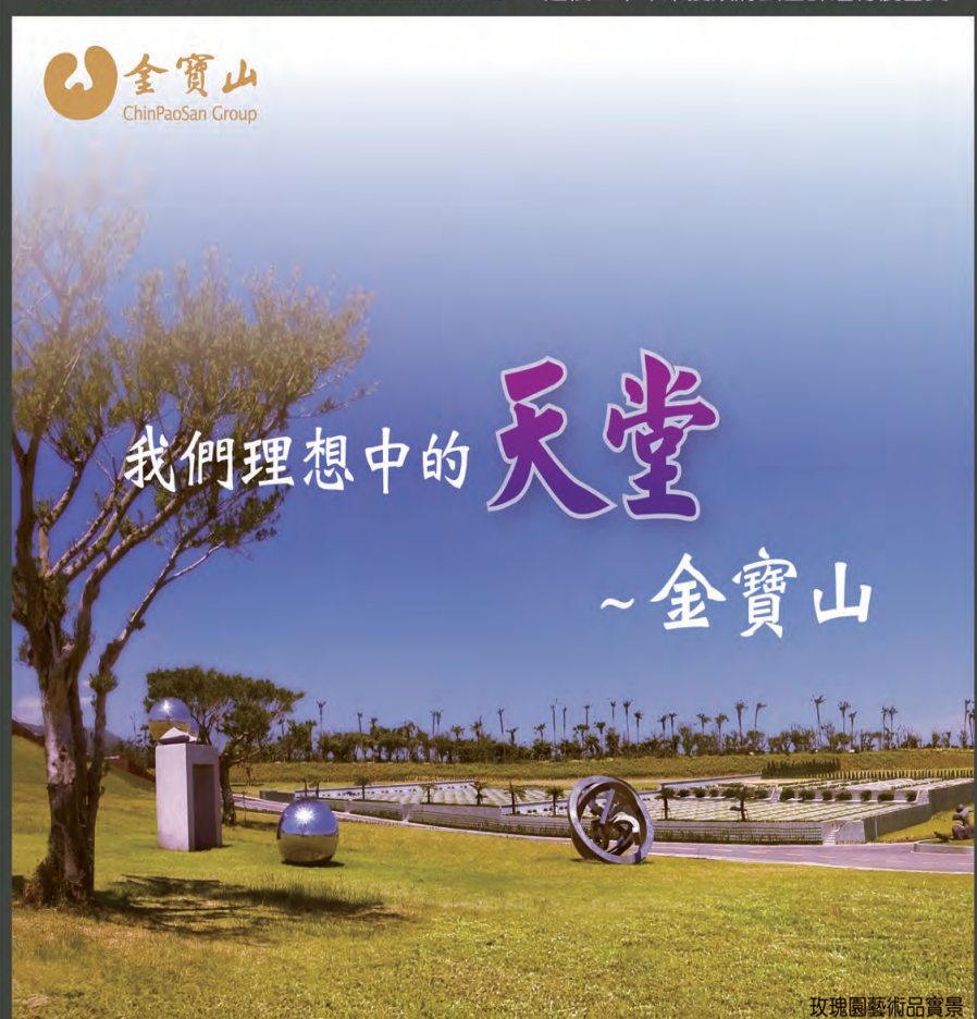
玫瑰園藝術品賞景