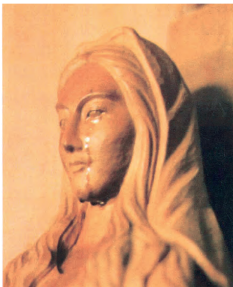
▲秋田聖母的流淚照片及拭淚的棉花球，見證這一神妙事蹟。

今年4月21日至25日，藉著耶穌基督復活慶期，聖家會修女們與聖家善會會員及熱愛聖母的弟兄姊妹，共計31人，興高采烈地參與日本秋田聖母朝聖之旅。這是大家內心渴慕已久，且時時耳聞的聖母在日本流淚顯現的「新鮮」事蹟。從構思到出發，從祈禱到成行，事就這樣成就了。