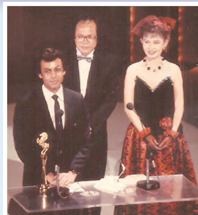
▲《殺戮戰場的邊緣》榮獲1987年金馬獎。