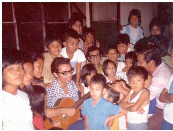
▲媒體與音樂都是丁松筠神父視為使命的福傳工作。

丁神父逝世後，在為丁松筠神父整理作品年表時，一一細列，才發現他的影視作品數量超乎想像，在這50年來，他與光啟社的夥伴們共同成就無數的節目、影片。這些作品，都反映著創作者的思想，都是許多人心血的累積，就如一位影視界前輩所言：「要製作1分鐘的電影，就得用上