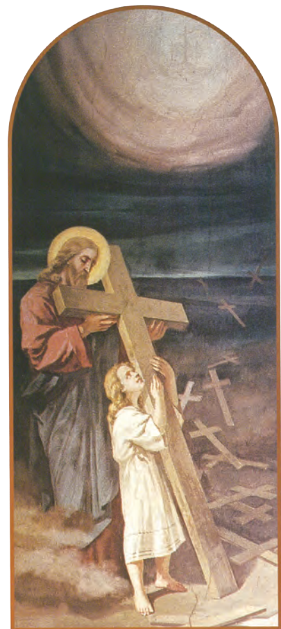
▲第5幅濕壁畫：小德蘭要背起粗重的十字架，但是耶穌隱藏在她背後，用雙手支持她。

教士也都一樣，用「你好我好」的「宗教交談」取代福傳宣講。傳教主保小德蘭對真理的執著，是我們的暮鼓晨鐘。