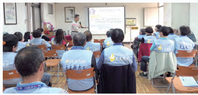
▲專注聆聽精彩課程