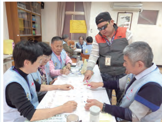
▲熱烈分享與分組討論