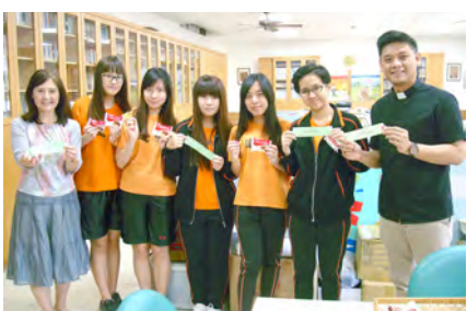
▲尋蛋、背誦經句、領獎品，身心靈獲享飽足！