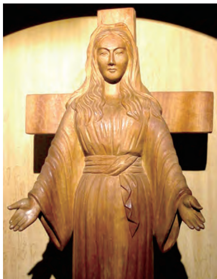
▲秋田流淚聖母態像至今雖已不再流淚，卻仍吸引了來自世界各地的朝聖者。