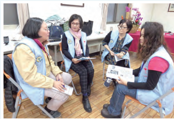
▲共同探討各種性格

幹部訓練內容非常實用，過去在團隊的帶領中難免遇到瓶頸，有時也不免疲憊，3次的幹部訓練讓我得到許多團隊帶領的方法，讓我重新得到力量與希望，期望和夥伴們重燃熱火，為山上的堂區做更多的服務。