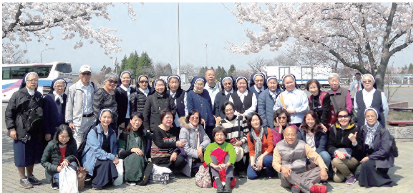
▲徜徉花林，盡情賞櫻，讚嘆造物主的奇工妙化。

朝聖之旅除了是踏在信仰的道路上更加深，且堅定我對信仰的認識和熱忱以外，也讓我看到了另外一個國家：「日本」宜人的風景、乾淨的街道和親切的服務態度。更要感謝旅途中的夥伴們，期待未來有機會能再次朝聖，拜訪其他不同國家的天主教會。祈祝復活的主賜我們平安！