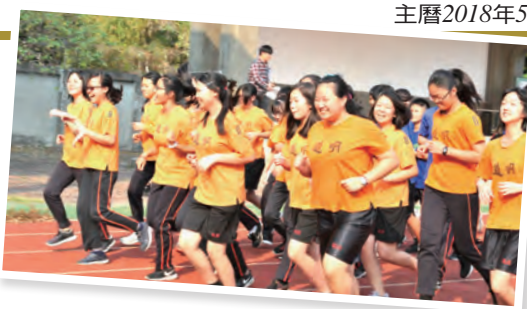
▲健跑行愛德，全校一起為愛動起來！