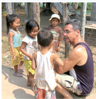
▲赴寮國參加傳播研討會，與當地孩子互動。

【信用卡捐款】寄電子信箱：kpstp.yen@msa.hinet.net 索取信用卡捐款單詳洽聯絡人：02-2771-2136#200 蔡姊妹或#217馮弟兄，誠摯感謝！