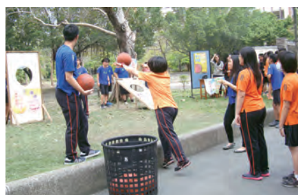
▲復活樂園遊戲，在喜樂中迎接挑戰！

看似簡單的活動，其實是想讓孩子們明白，生活中我們需要有明確的目標和方向，雖然在達成目標的過程中我們也許會經歷挫折跟失敗，有時甚至必須重頭來過，但當我們克服了重重困難，便能得著當得的獎賞。正如《希伯來書》12:2所說「祂為那擺在祂面前的歡樂，輕視了凌辱，忍受了十字架，而今坐在天主寶座的右邊。」耶穌因著對我們的愛，寧願受苦，祂清楚自己所做的事是「值得」的，因此祂輕看一切苦楚。我們是否也能看見真正有價值的事並為此付上代價呢？