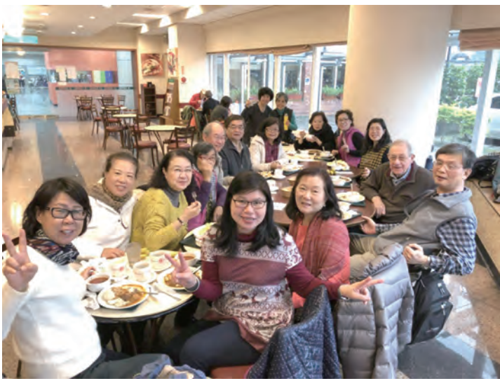
▲志工共融餐敘上分享服務心得，其樂融融。

大家都很認真服務，為主做工，心情是快樂的。因為「天主是愛」、「施予比領受更為有福。」希望更多的弟兄姊妹們都能來參與我們這個快樂的大家庭——中興院區祈禱室志工團隊，願天主降福每一個人。