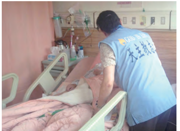
▲祈禱室志工照顧病患的心靈，堅強信德，以交託病苦。

意，在大合照上標示姓名，加深印象！在主內，我們本都是一家人，透過3個月一次的共融，大家感情融洽，更有助於團結合作，為病人服務。我們誠摯地歡迎有意願服務的弟兄姊妹們加入喜樂獻愛的行列，一起成為天主所中悅的好用器皿。