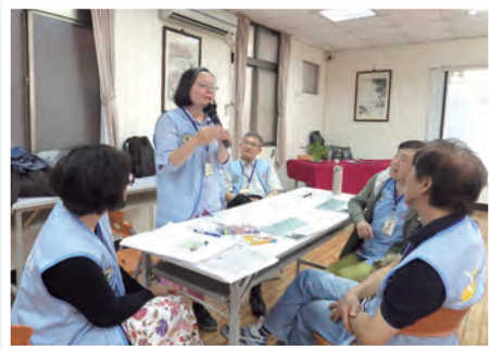
▲報告小組集思廣益成果

從模擬操練中再回到現實，落實我們的使命-服務，就如同上主對若蘇厄的派遣，我們以裝備好的方法與能力，勇敢、堅決、果斷，回到堂區，邀請團隊的夥伴為上主作見證，努力做好志工幹部的使命，面對挑戰，為主服務。