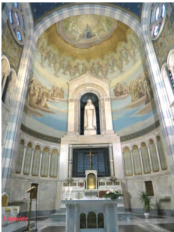
▲義大利第一座奉聖女小德蘭為主保的聖堂，以16幅濕壁畫詮釋「神嬰小道」；聖堂最底半圓穹頂的大濕壁畫，描寫神嬰小道的凱旋，聖女引領很多很多平凡的靈魂走向天主。祭台上方的聖女小德蘭的立體雕像是Castiglioni的作品。