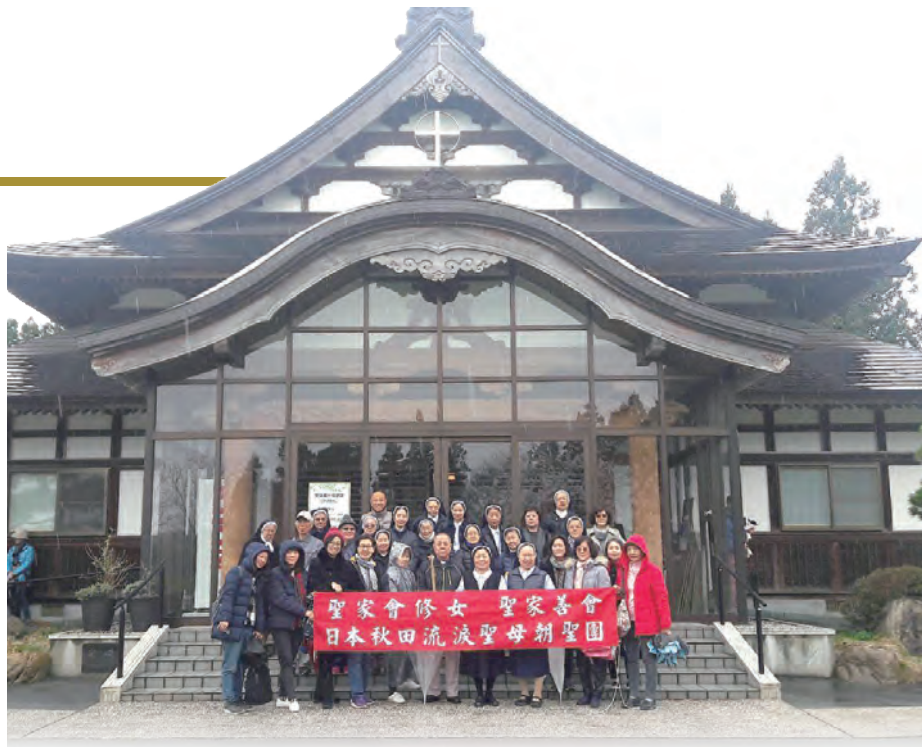
▲在秋田聖體仕奉會修道院的聖堂前合影

第2天前往「十和田湖」，搭船遊湖並進入飛瀑、湍流、怪石和繁茂叢林的奧入瀨溪流。十和田湖位於青森縣和秋田縣的邊界海拔400米的山上，200萬年前火山多次活動導致，改變而形